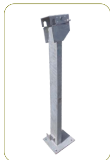
* Suporte de fixação para contentores de pequena capacidade