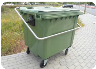
* Suporte de fixação em aço inoxidável