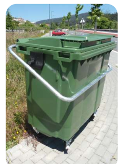
* Suporte de fixação em aço carbono