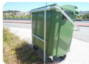
* Suporte de fixação em aço carbono