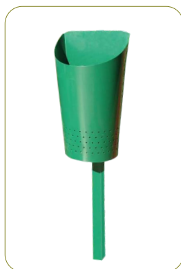
* Papeleira «Évora» - Refª 371