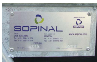
Chapa com numeração