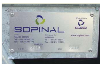
Chapa com numeração