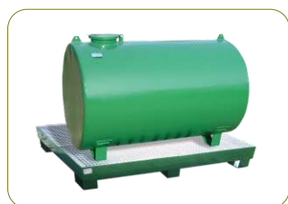
* Oleão - Refº 231