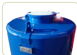
* Oleão - Refº 230