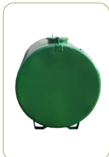
* Oleão - Refº 231