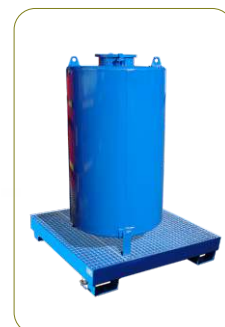
* Oleão - Refº 230