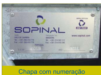
Chapa com numeração