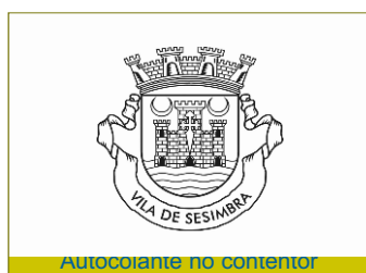
Autocolante no contentor