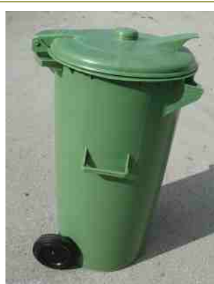
Contentor 110Lts com rodas