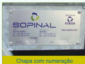
Chapa com numeração