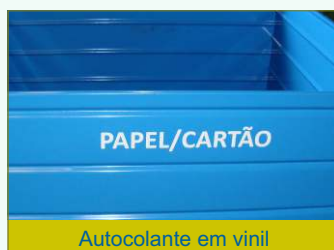
Autocolante em vinil