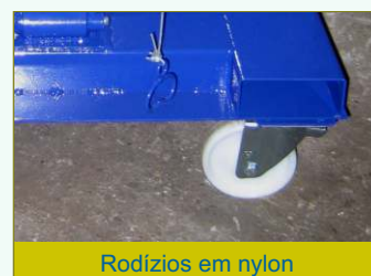
Rodízios em nylon