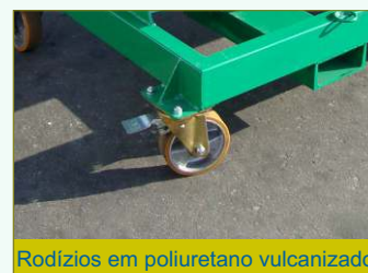
Rodízios em poliuretano vulcanizado