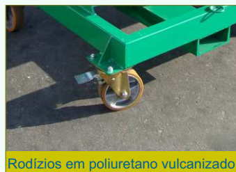
Rodízios em poliuretano vulcanizado