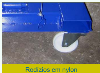
Rodízios em nylon