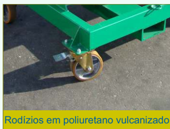
Rodízios em poliuretano vulcanizado