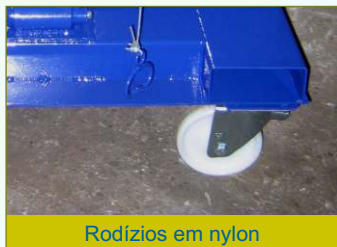
Rodízios em nylon