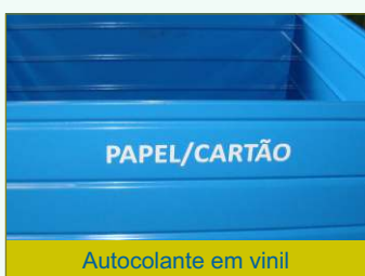
Autocolante em vinil