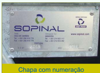
Chapa com numeração