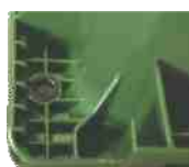
Local para chip