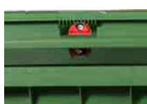
Diversos sistemas de fecho