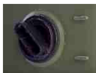
Saída inferior de líquidos