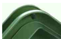
Sistema de redução de ruído