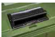
Bocas para recolha selectiva de resíduos